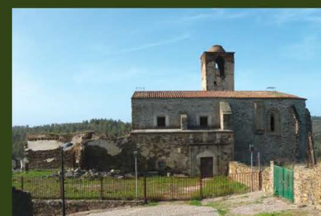
Convento de Sancti Spiritu