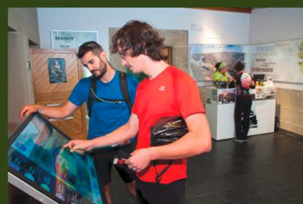
Centro de interpretación Parque Natural Tajo Internacional