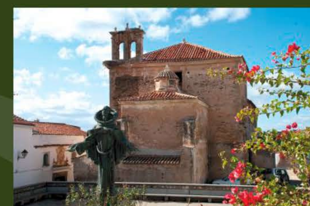
Imagen e iglesia de San Pedro de Alcántara.

From here the trail continues along the western boundary of the town until it meets the Camino Natural del Tajo, right at the intersection with the old cañada real de Gata, with which it will run together for a few meters before leaving it to descend among terraces and olive trees, and return to the vicinity of the bridge, where the route ends. And one last tip: you should often look to the sky, remember that you are in the heart of the Tagus International natural park and along the whole course it is possible to observe large raptors in flight such as griffon vultures, golden eagles and Bonelli's eagles, owls, booted eagles... and even the timid black storks.